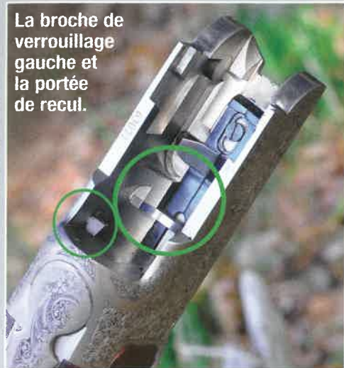
La broche de verrouillage gauche et la portée de recul.