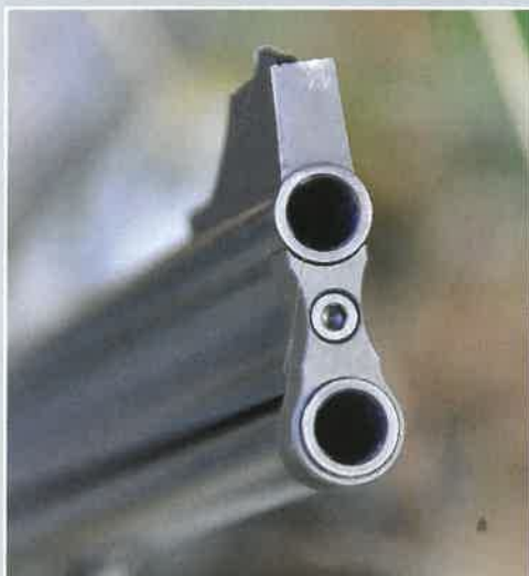
Les bouches des canons avec la bride assurant la cohésion du faisceau.