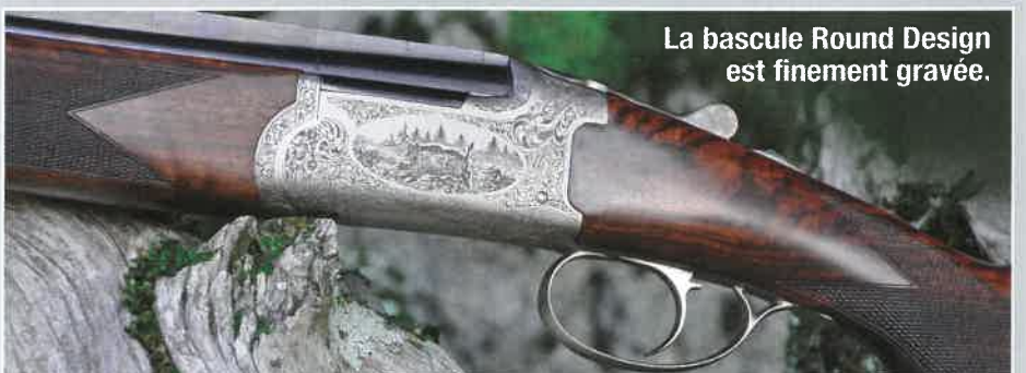
La bascule Round Design est finement gravée.