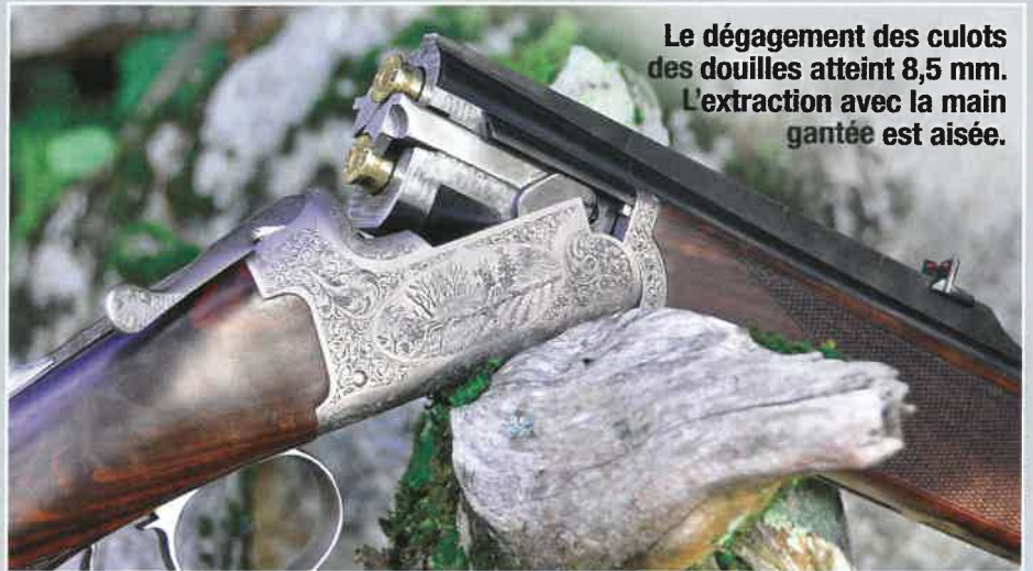
Le dégagement des culots des douilles atteint 8,5 mm. L'extraction avec la main gantée est aisée.