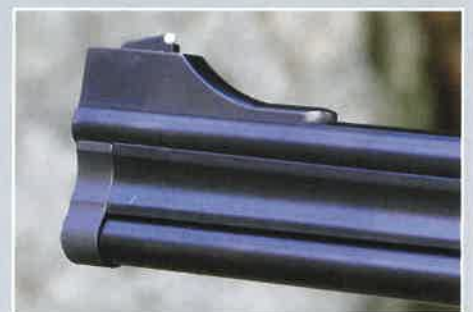
Le guidon monté sur rampe est réglable en site (hauteur).