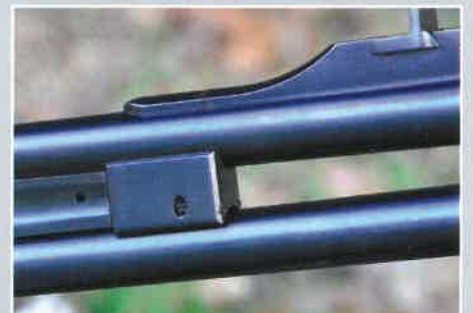
La cale de réglage de la convergence.