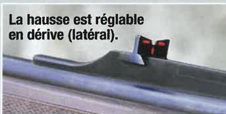
La hausse est réglable en dérive (latéral).